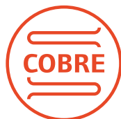
Serpentina de Cobre