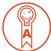
Selo Procel A