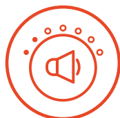
Baixo Nível de Ruído