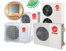
Terminal Block ในคอนเดนซิ่งยูนิตไม่มาตรฐาน และผ่านมาตรฐาน IEC60335-2-40