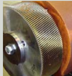
Kompresör kasasında korozyon