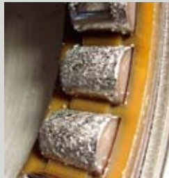
Kayar mesnet arızası